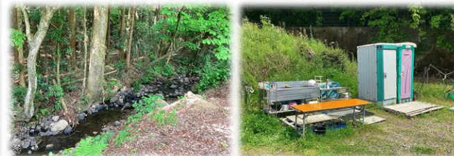
本物件西側を流れる沢