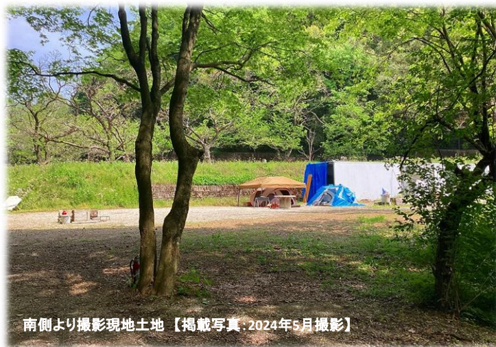
南側より撮影現地土地【掲載写真:2024年5月撮影】